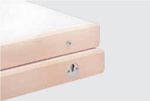
Verbindung Einhängeplatten connection of intermediate table tops